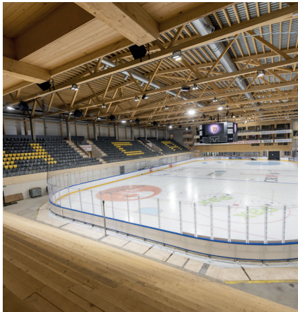
Raiffeisen Arena, Porrentruy

Wir bauen leidenschaftlich mit Holz und beachten dabei die natürlichen und menschlichen Bedürfnisse. Wir respektieren die Individualität dieses genialen Werkstoffes genauso sehr wie die der Menschen in unserem Alltag.