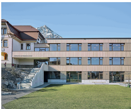
Anbau Primarschulhaus, Aeschi

37 Holzbauingenieure FH/HTL, davon 20 mit Weiterbildung zum Brandschutzfachmann VKF, 12 Techniker HF, 7 Praktikanten, 11 Administration und Zentrale Dienste