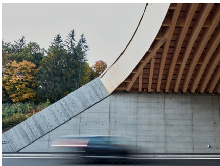
Wildtierbrücke Rynetel, Suhr